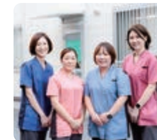
訪問看護ステーション